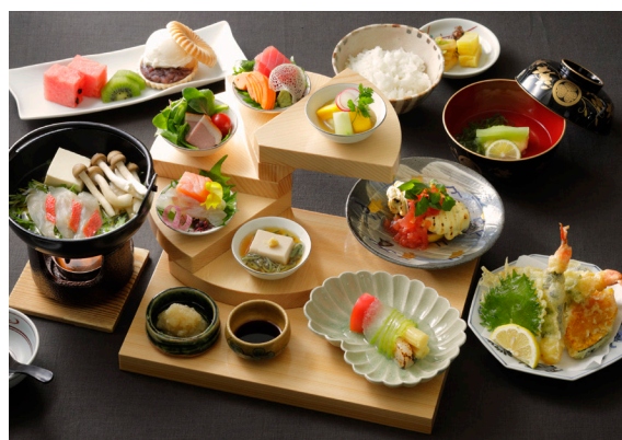
会席料理「天守」 5,500円(税込) あいちの名工近澤料理長による会席料理。