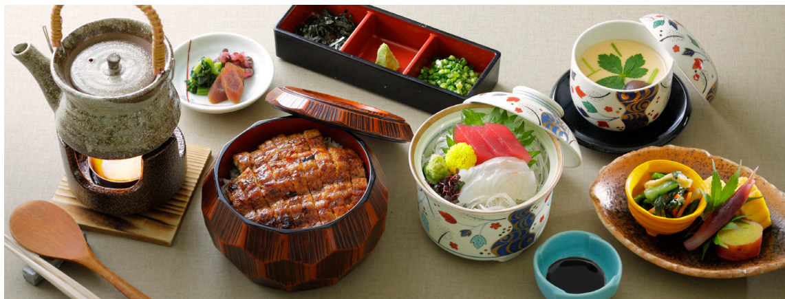
ひつまぶし御膳 3,850円(税込) 前菜、お造り、茶碗蒸しを加えた豪華な御膳。当店一番人気メニュー。