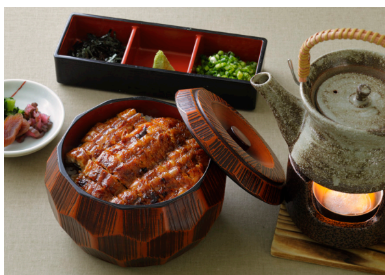
ひつまぶし(単品) 3,000円(税込) 名古屋名物ひつまぶし。